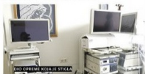
DIO OPREME KOJA JE STIGLA