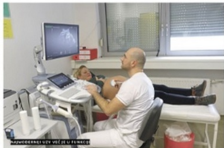
NAJMODERNIJI UZV VEĆ JE U FUNKCIJI