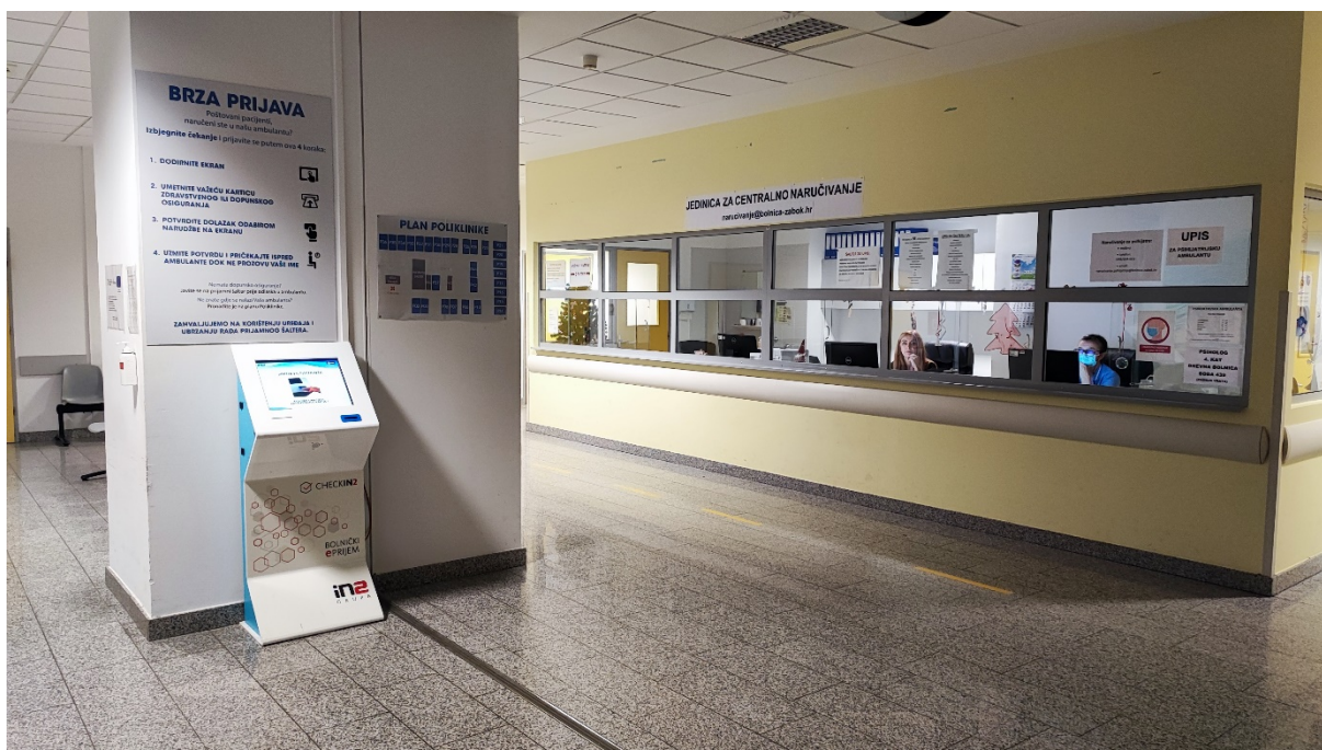
Slika 3. Jedinica za centralno naručivanje

Detaljnije na Internet stranicama bolnice.