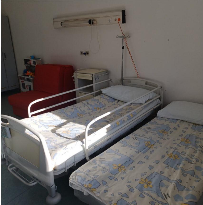
Slika 4. Bolnički kreveti – odjel pedijatrije