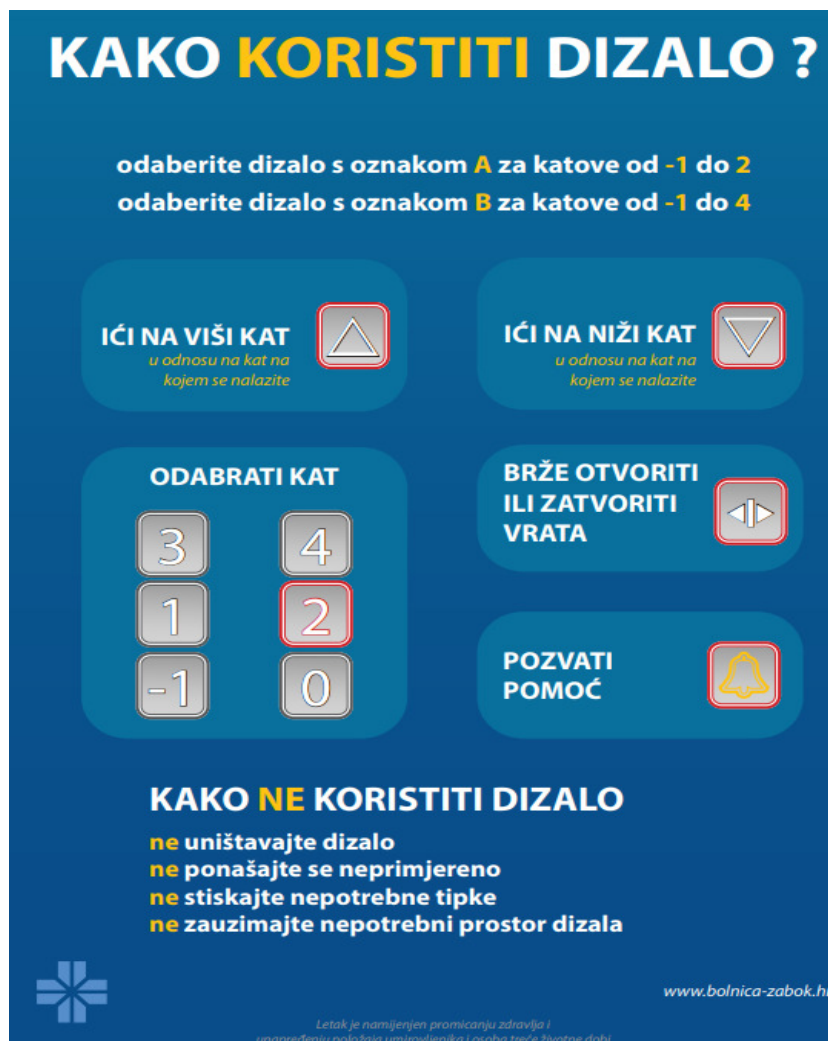
Slika 5. Upute kako koristiti dizalo